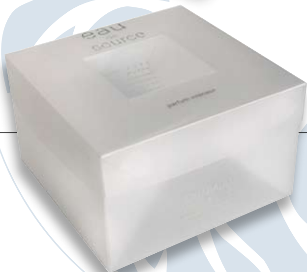
Carton de création gris 2 tons Marquage à chaud argent