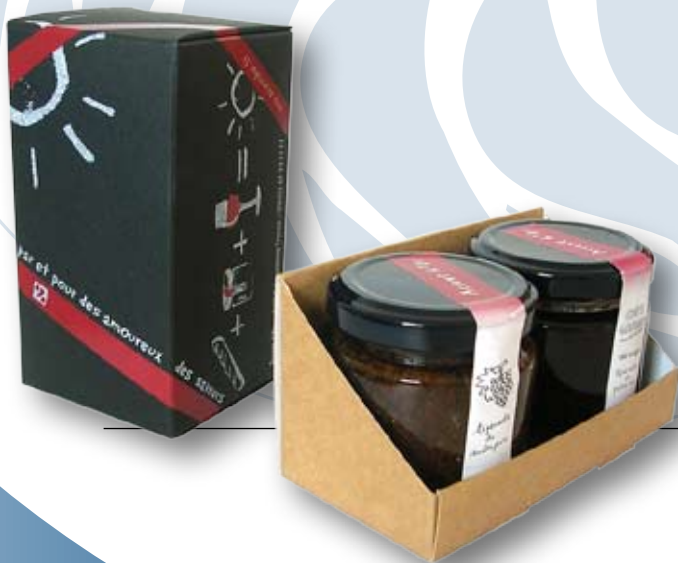
Carton de création noir Impression sérigraphie UV 2 couleurs