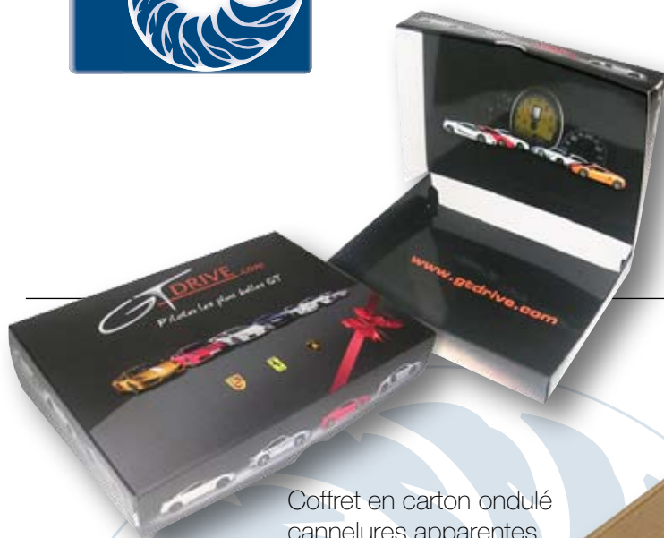
Boîte cadeau Quadri pelliculée contrecollée sur Frövi 250 g