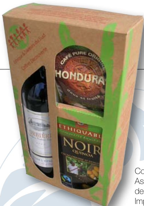
Carton Frövi 350 g Impression sérigraphie 2 couleurs