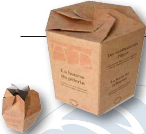
Boîte + calage en micro Aplat flexo, impression sérigraphie